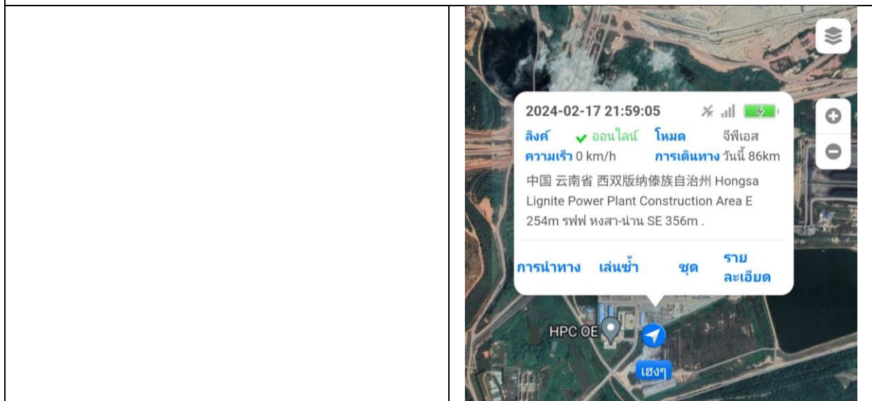
สรุปการใช้รถ 3145 86km