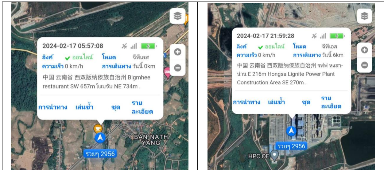
สรุปการใช้รถ 2956 6km